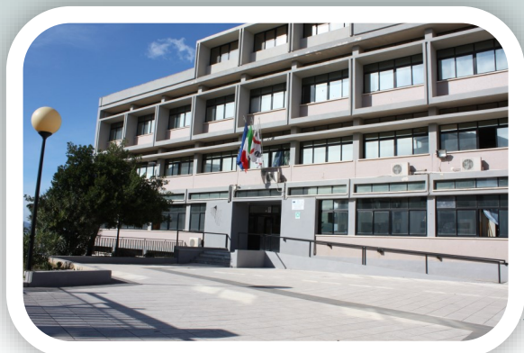
SEDE CAGLIARI Via Bainsizza n° 30 tel.: 070.201631